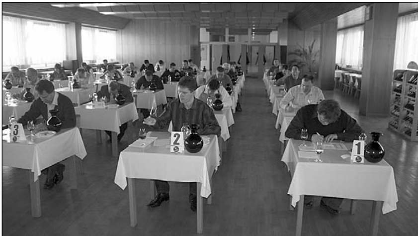
Tiché soustředění - odborná degustace vyžaduje notnou dávku pozornosti a letité zkušenosti.