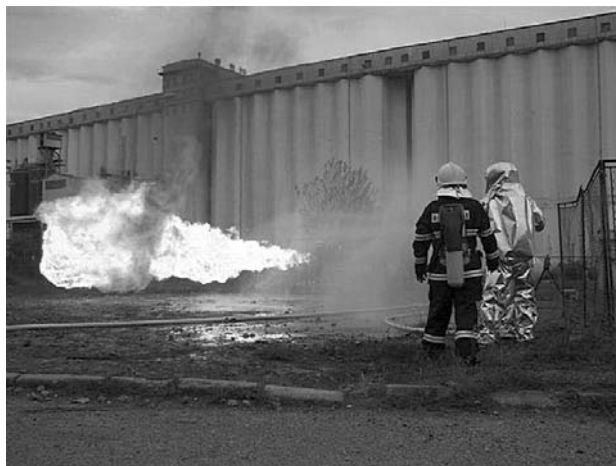
Plameny vypadaly hrozivě, naštěstí šlo tentokrát pouze o simulovaný zásah.

Cvičení pro hasiče vedl rakouský specialista na bezpečnost v oboru plynárenství, který dovedl zaujmout nejen atraktivními plameny, ale i praktickými ukázkami. Kupříkladu bylo znázorněno ve skleněné nádobě, jak se chová propanbutan v tlakové láhvi při odběru nebo jak se takový plyn chová, když uniká zkapalněný. Dokonce nám bylo předvedeno, že je možné tento zkapalněný plyn umístit do nádoby bez víka (nádobu okamžitě omrzla, protože plyn má -42 °C) a zapálit jej. Bez tlaku hoří jako olympijská pochodně.