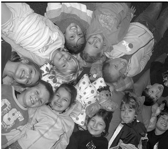
Spokojené a veselé děti? Ta nejlepší vizitka kvalitní zábavy!