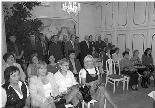
Ročník 1959 byl při příležitosti svých kulatých narozenin slavnostně přijat na radnici města.