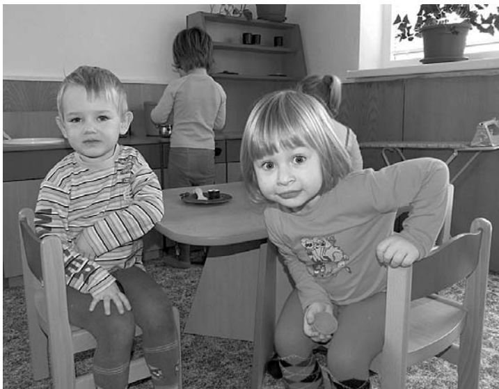
Júúú, máme novou kuchyňku, pojďte dál...

Sponzorovi, který si nepřeje být jmenován, mateřská škola velmi děkuje.