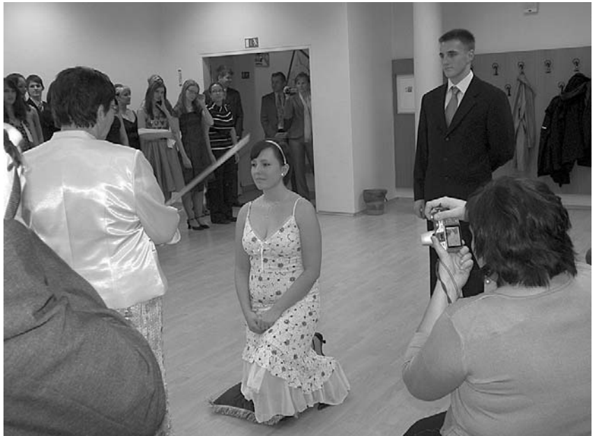
Pasování studentů 4.A na právoplatné maturanty. Ke zkoušce dospělosti předstoupí již za necelého půl roku.

Poté již nic nebránilo tomu, abychom byli jednotlivě pasováni mečem na maturanty a odekorováni stužkou, na kterou jsme si zvolili motto: „ Zavírám knihu, otevírám život. “ Slavnost stužkování uzavřel