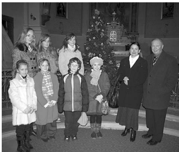
Dolnokounický kostel sv. Petra a Pavla rozezpívaly děti z Velkých Pavlovic.