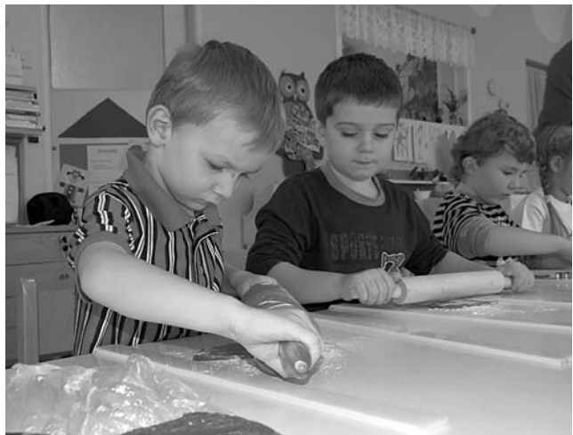
... pekli kluci.