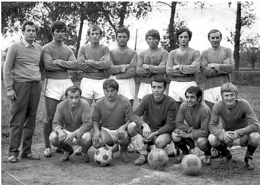
Z let osmdesátých.

období jeho historie. V sezoně 1986-87 hrálo mužstvo III. třídy, z 26 utkání zvítězilo v tomto ročníku celkem 25x a jen jedenkrát remizovalo. Celkové skóre 153:24 se zapsalo do historických tabulek. Vítězství 20:2 ve Starovicích, 10:0 v Boleradicích, 13:2, 10:0 a 8:0 na domácí půdě dávali jasně najevo rostoucí sílu velkopavlovické kopané. To vzápětí dokázaly další sezony. Hned příští sezonu 1987/88 se mužstvo