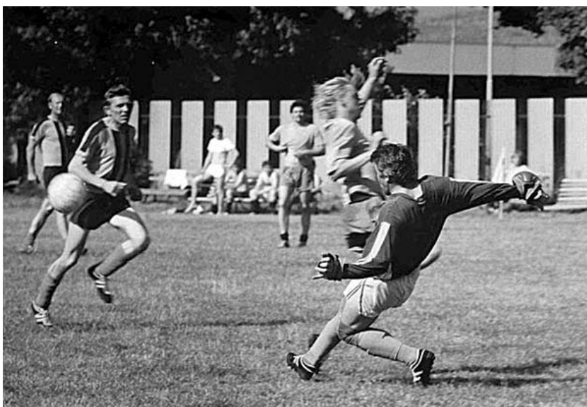
Fotbalový zápas – rok 1987.

velmi silnými týmy z Brněnska. V průběhu 70. let se podařilo několikrát postoupit do I.B třídy. Hlavní vzestup velkopavlovické kopané se ale traduje od poloviny 80. let. V sezoně 1985/86 mužstvo sestoupilo dokonce až do III. třídy okresních soutěží. V tomto období začíná také největší rozkvět fotbalu ve Velkých Pavlovicích za celé