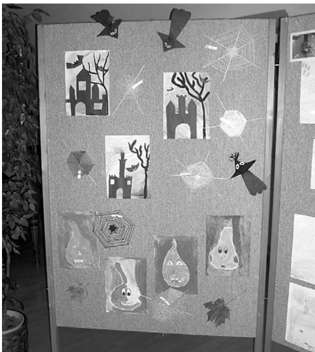
Ukázka krásných výtvarných děl našich školáků.