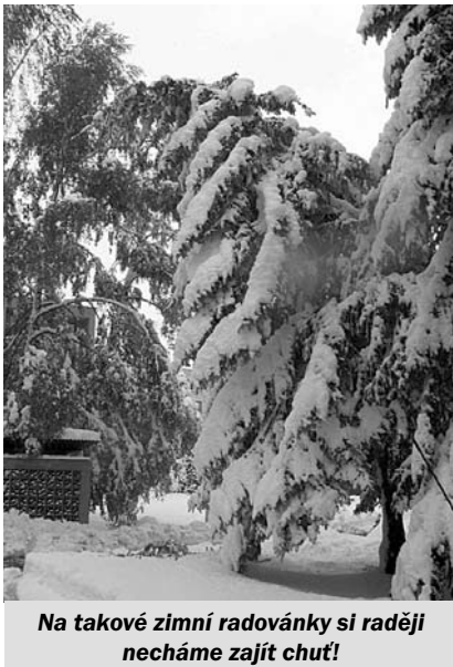
Na takové zimní radovánky si raději necháme zajít chuť!

rychlé nadílky praskaly nejen dráty vysokého napětí, ale i větve stromů. Celé město bylo vzhůru nohama a jako vždy v obdobných situacích – nejvíce práce měli hasiči a zaměstnanci služeb města. Nyní je v Ždírci již vše v pořádku, jako vzpomínku a gesto souznělosti zveřejňujeme alespoň následující fotografii.