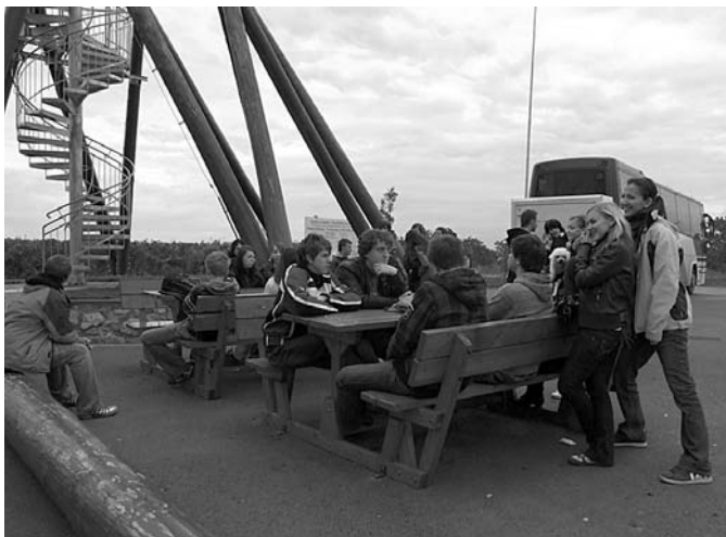
V rámci poznávání okolí našeho městečka nemohli seniční minout novou dominantu Velkých Pavlovic – rozhlednu Slunečná. Odměnou za zdolání všech pětasedmdesáti schodů jim byl úžasný výhled do lůna pestrobarevné podzimní krajiny jihu Moravy.