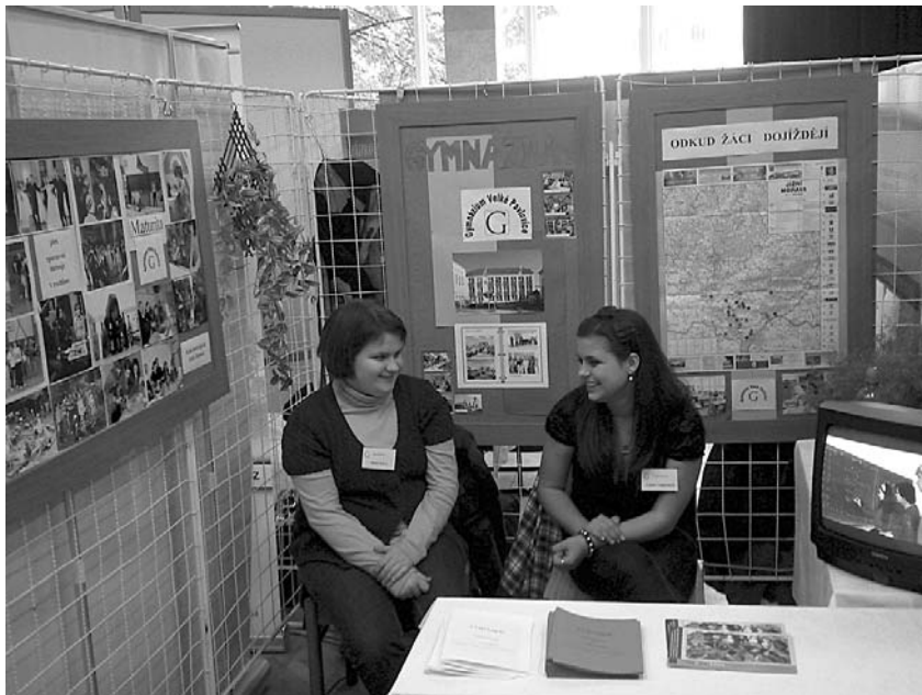
Studentky velkopavlovického gymnázia reprezentovaly školu i město na jedničku!

Žákům končícím povinnou školní docházku a jejich rodičům podávali infor-