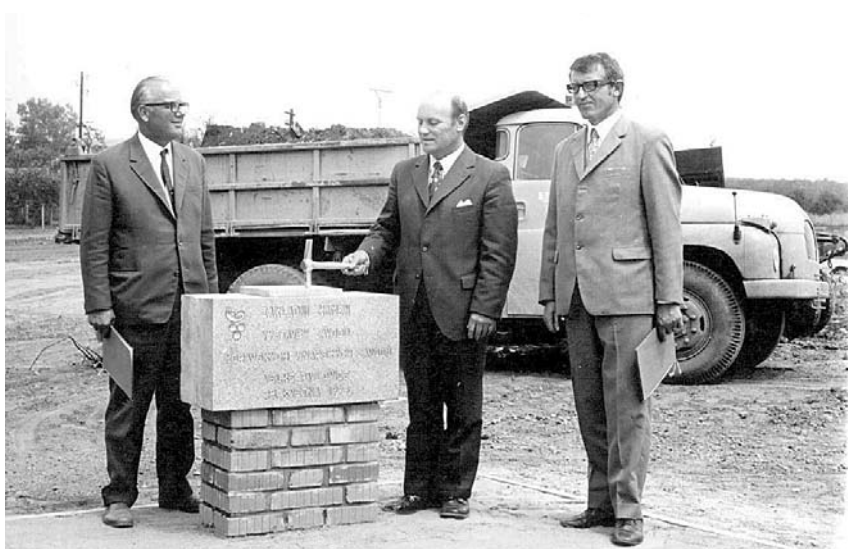
Poklepání na základní kámen výstavby Moravských vinařských závodů – 28. května 1974.

Patří mu za ni poděkování celé široké vinařské veřejnosti. Zanechává nesmazatelnou stopu v historii velkopavlovického