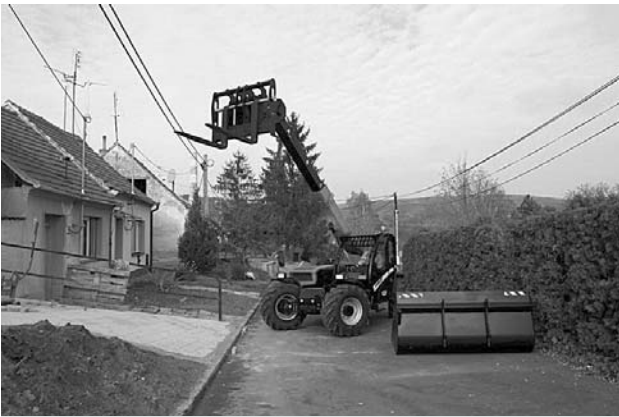
Manipulátor Farezin měl pracovní premiéru v ulici V Údolí.

Služby města Velké Pavlovic využívají od 2. listopadu 2009 nového multifunkčního pomocníka - manipulátor Farezin, který zefektivní práci při výstavbě a údržbě města. Premiéru měl na pokládce dlažby na chodníku v ulici V Údolí.