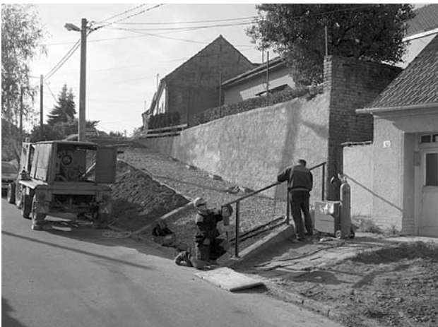
Chůze po novém chodníku se zábradlím v členitém terénu ulice V Údolí je již mnohem komfortnější a bezpečnější.

Na ulici V Údolí probíhá oprava úseku chodníku, který byl již delší dobu v havarijním stavu. Po likvidaci starých betonových dílců byl vybudován nový kufř s obrubníky, byly osazeny prvky na odvod dešťové vody. Dále proběhla montáž zábradlí, následovalo položení dlažby a ozelenění okolí.