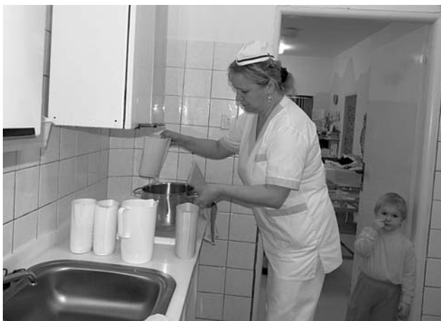
Příprava svačinek v nové kuchyňce jde paní kuchařce od ruky!

a podnikatelů našeho městečka. Přestože si nepřáli být jmenováni, celá školka a děti především, jim za štědrot velmi děkují!