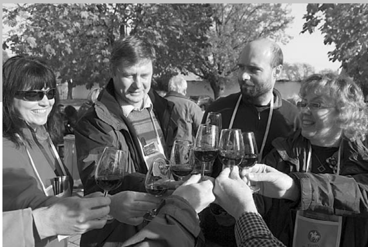
Před radnicí teklo víno proudem ...

Pro hosty byla u prodeje vstupenek před velkopavlovičskou radnicí připravena pravá slovácká zabijačka - ovar, černá polévka, jitrnice, jelita, tlačěnka a gulášek, aby si mohli ochutnávající vytvořit podklad pro degustaci mnoha vzorků vín.