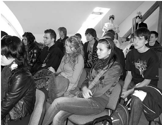
Slavnostní přijetí senických studentů na radnici města ve Velkých Pavlovicích.