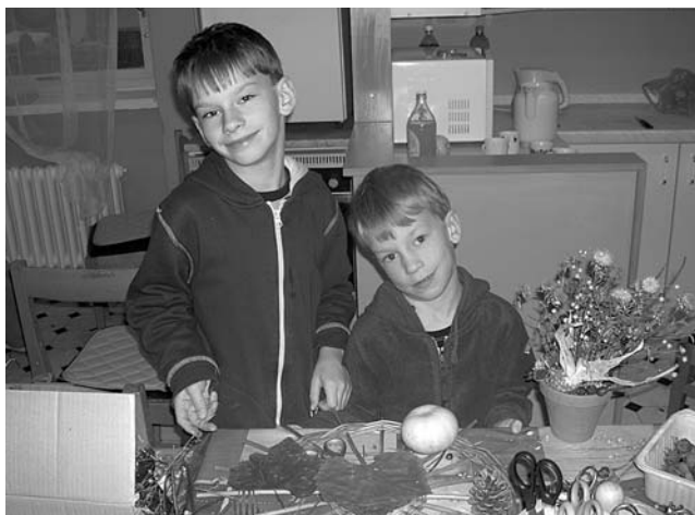
Kluci v akci!

ozdobu předsině nebo domovního vchodu? Naše děti by vás jistě přesvědčily o opaku. A tak se na SVČ vyráběly květináče, podzimní věnce, ale také figurky ze samých přírodnin. Každé dítě je jiné, každé má svůj osobitý vkus a proto vznikla nepřeberná škála rozmanitých dekorací a vazeb.