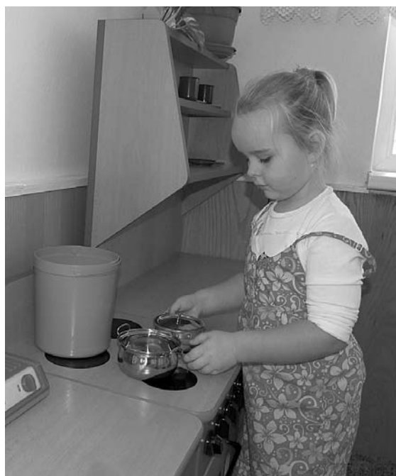
... přichystáme vám něco na zub!