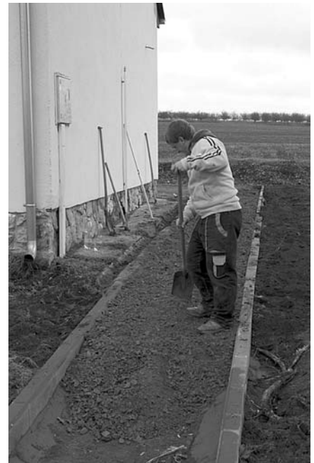
Příchod k zastávce ČD je opět o něco pohodlnější, okolí budovy pěknější.

Bohužel, neustálé rozbíjení veřejného osvětlení, laviček a ničení veřejné zeleně vandaly snižuje hodnotu prostředí, které v posledních letech prodělalo zásadní změny k lepšímu. S politováním musíme však konstatovat, že jsou vandalové skutečně jen stěží přemozitelní soupeři. Boj s nimi se mnohdy podobá boji s pověstnými větrnými mlýny.