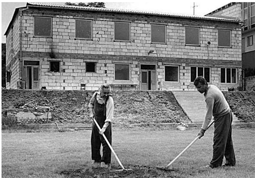
Rok 1983 – hrubá stavba nové budovy TJ Slavoj (dnes ubytování, restaurace, šatny a společenský sál)

stal se ještě platným hráčem „A“ týmu i ve svých 41 letech. V roce 2007 byl vyhodnocen do Jedenáctky roku okresu Břeclav. V současné době hraje za „B“ mužstvo a trénuje žáky.