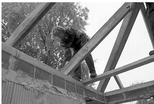
Práce se dřevem je náročná, leč voňavá.

Tesařská firma Kocián, která v létě opravovala krov kostela, staví také střechu na baště u rybníka. Po přípravě prvků vazby byly vztyčeny krovy na první části budovy. Dodavatelská firma se při opravě kostela potýkala s každodenními dešti, po několika měsících sucha opět tesařům po příjezdu do Velkých Pavlovic přšelo každý den na hlavu. Ovšem tesaři jsou tvrdí chlapi!