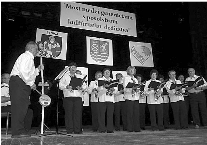
Jak mezi protagonisty hlavního kulturního programu tak i mezi obecnstvem byli mladí i starší, ve vzájemné souhře a porozumění...

Jak jsme se mohli přesvědčit z nadšených ohlasů velkopavlovických účastníků zájezdu, výlet byl naprosto na jedničku. A jak jej hodnotí pořadatelé a zároveň i neskutečně štědrí hostitelé na slovenské straně hranice?