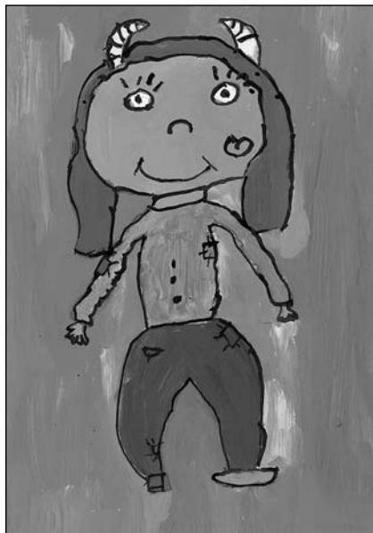
Obrázek Sandry Pláteníkové