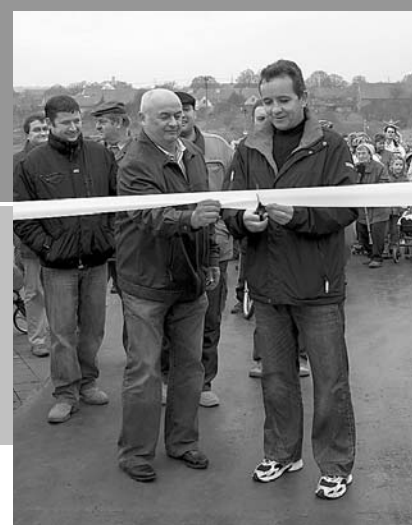
Přestřžením stuhu byla k radosti veškeré pohyb milující veřejnosti oficiálně uvedena do provozu nová cyklistická stezka z Velkých Pavlovic do Bořetic.

Přestože neleží rozhledna Slunečná bezprostředně na trase nové cyklostezky,