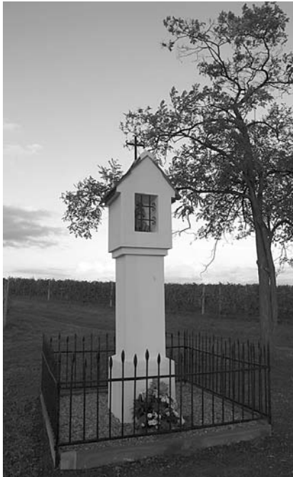
Kaplička sv. Vendelína nedaleko Velkých Pavlovic.