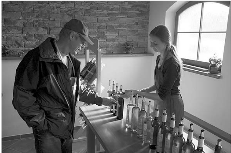
... stejně jako ve všech sedmnácti otevřených sklepech.