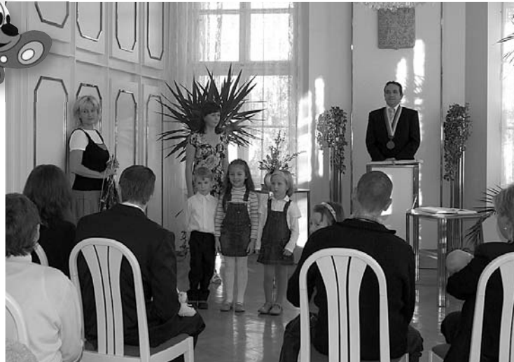
Vítání občánků v obřadní síni na radnici města V. Pavlovice.