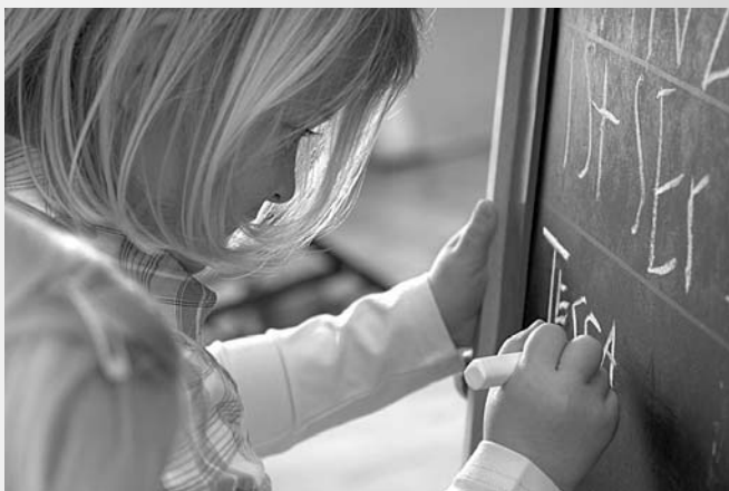
Přestože se děti snaží, někdy jim to ve škole skutečně nejde. Pak je nutné přijít na to - proč?

Každá z uvedených forem poruch může být považována za příznaky poru-