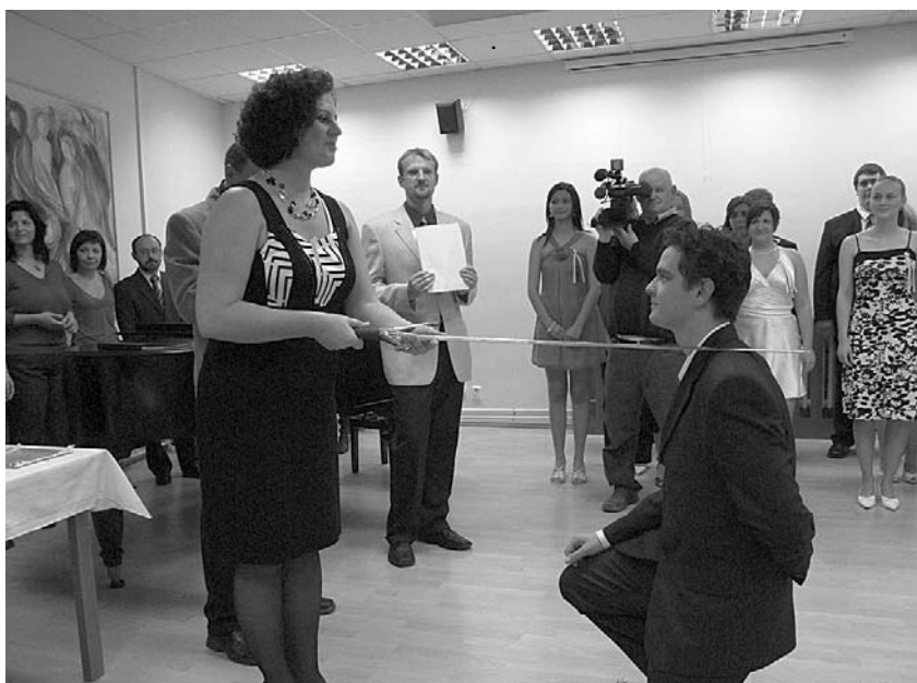
Stužkování do řad maturantů je životním mezníkem, na který se nezapomíná. Studentům přejeme pevné nervy a šťastnou ruku při výběru maturitních otázek.