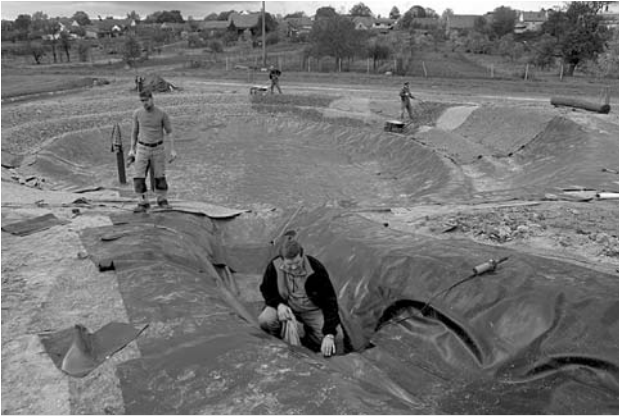
Jezírko v novém parčíku – cíl vycházek po městě a příjemné místo vhodné pro relaxaci.