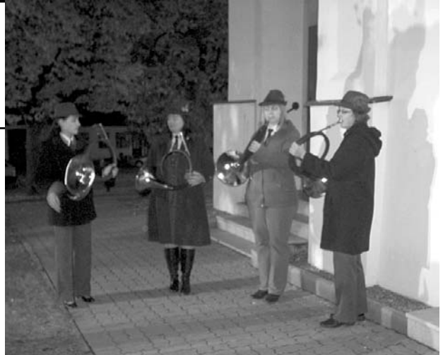
Trubačky Mendelovy zemědělské a lesnické univerzity v Brně rozezněly libými tóny velkopavlovický kostel.

Mše, kterou provázela duchovní lovecká hudba, při-