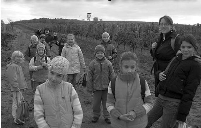
Putování podzimní krajinou na Slunečnou...

Na SVČ bylo během podzimních prázdnin opravdu veselo. Pro děti byl připraven dvoudenní minipříměstský tábor. Vše začalo ve čtvrtek 29. října 2009 v osm hodin ráno. Středisko obsadilo jedenáct dětí, které nechtěly sedět doma a toužily se skvěle bavit.