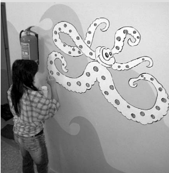
Lenka Veverková vládne štětcí a barvám bez nadsázky mistrně!

Během měsíce října prošlo SVČ takřka kompletní výmalbou. Dříve nevhledně rádobí bílé stěny nám pan malíř Štefka pokryl zářivými barvami, aby se SVČ stalo pro děti ještě atraktivnější a lákavější. Barvy jsme volili skutečně pečlivě a s rozvahou.