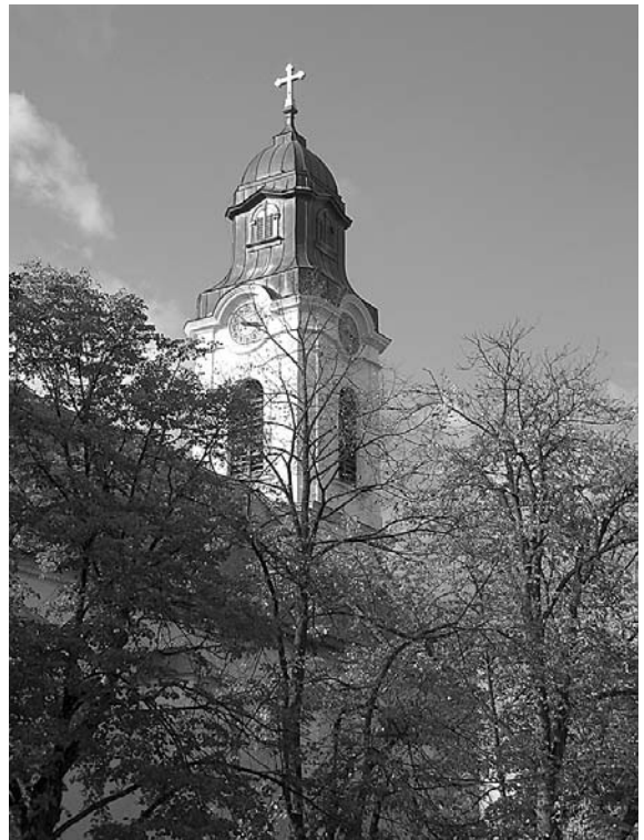
Kostel Nanebevzetí Panny Marie ve Velkých Pavlovicích