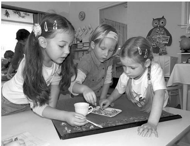
Pekly holky ...