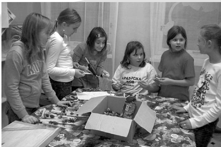
Voňavé svíčky udělají jistě radost pod nejdřívým vánočním stromčkem!

Všechna dítka si domů odnášela pěkné voňavé výrobky, kterými jistě potěšila své maminky, tatínky, babičky, dědečky, tety i strýce.