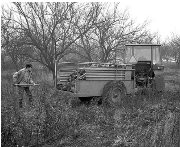
Rozvoz cukrové řepy po revíru.

Sychravé podzimní období je v souvislosti s myslivostí spojováno především s lovem, ale právě v tomto čase pro myslivce nastávají povinnosti s příkrmováním zvěře. Zvěř si musí předem zvyknout na místo, ke kterému se má na krmení v zimě stahovat. Musí včas zjistit, kde cukrovku, kukuřici, pšenici a seno najde. Zároveň se tak myslivci snaží předcházet škodám, které by zvěř v zimě napáchala na trvalých porostech.