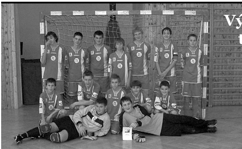
Fotbalový tým ZŠ Velké Pavlovice.

Po dohodě s autorkou vítězného návrhu bude vytvořeno několik variant tohoto loga v různých barevných kombinacích za použití rozdílných fontů, ze kterých bude vybrán ten výsledný. Můžete s námi napjatě očekávat výsledek.