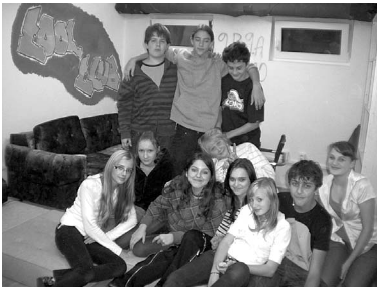
Veselé prostředí ušité teanegrům přímo na míru - záruka příjemného trávení volného času.

Kladete si otázku, co je to Cool-klub? Pak vězte, že je to malá nenápadná míst-