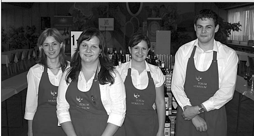
Bez kvalitní obsluhy se žádná přehlídka vín neobejde. Na letošní Promenádě nalévala mládež z velkopavlovické chasy.