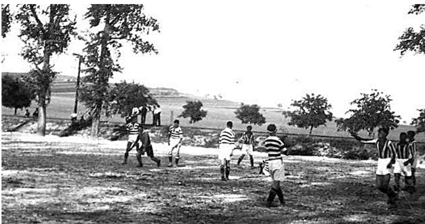
I tak se kdysi hrávalo...

jaře roku 1930 se nově vzniklému oddílu kopané podařilo získat od obce pozemek „Za Svodnicí“, kde se začalo budovat fotbalové hřiště. Nadšeným úsilím všech členů postupovaly práce tak rychle, že ještě v červnu téhož roku bylo hřiště slavnostně otevřeno. Od roku 1931 se tradují také červená a bílá klubová barva, podle pamětníků byly barvy zvoleny dle kvalitních velkopavlovických vín. První výsledky ze soutěží fotbalového oddílu jsou z roku