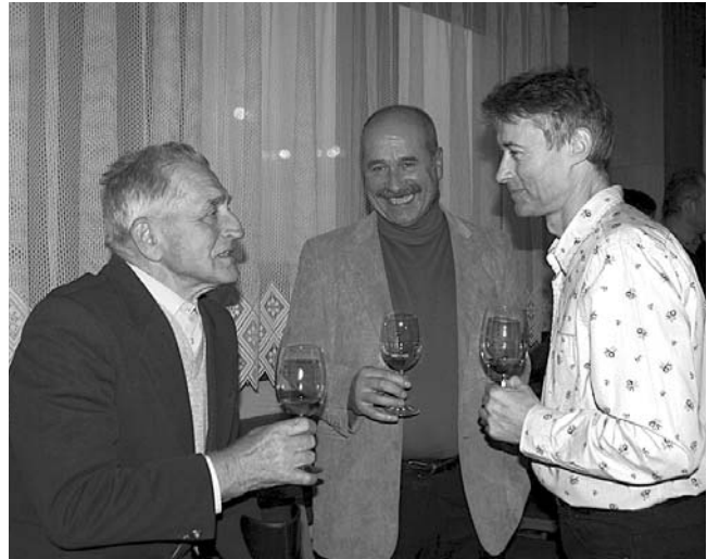
Mladé víno ročníku 2009 dosahuje mimořádných kvalit, všem hostům slavnostního odpoledne velmi zachutnalo.