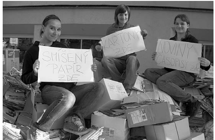
Žákyně deváté třídy nenechaly nic náhodě. I zdánlivě obyčejný sběr papíru musí být do detailu zorganizován :-)

Všem žákům, kteří se zúčastnili sběru papíru, děkujeme. Sběrem starého papíru přispíváte k záchraně lesů a ochraně naší přírody!!!