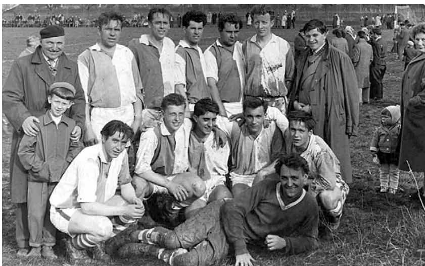
Archivní fotografie dokumentující život TJ Slavoj od samých začátků.

V prosinci letošního roku oslaví fotbalový oddíl Slavoj Velké Pavlovice 80. výročí svého vzniku. Patří tak k nejstarším fotbalovým oddílům na okrese Břeclav. Dovoďte mi, abych Vám stručně přiblížil historii fotbalu ve Velkých Pavlovicích.