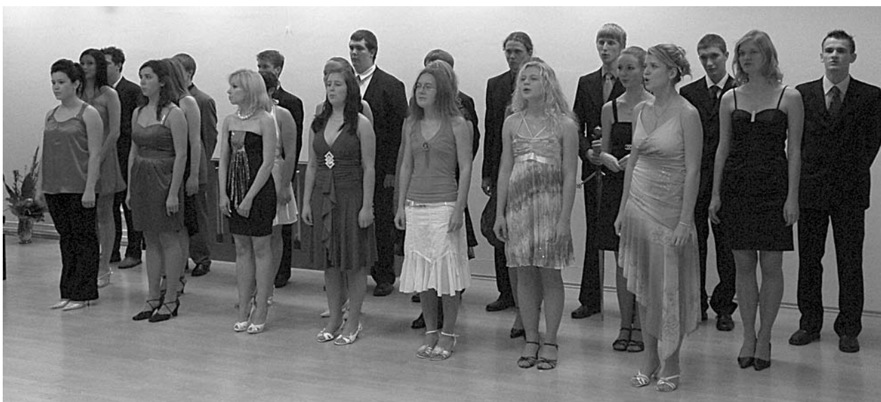
Třída studentů velkopavlovického gymnázia, jež složí na jaře roku 2010 svou opravdovou první „zkoušku dospělosti“