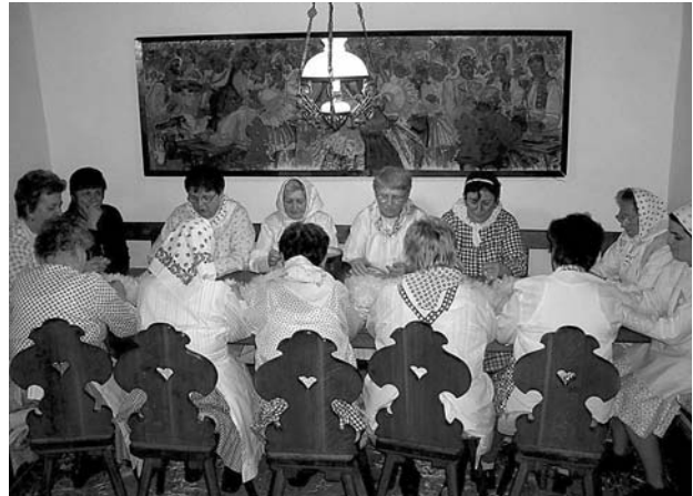
U draní peří se přetřásaly místní klevety...

Rovněž tak taneční zábavy nebyly jen místem k tancování. Starší ženy se sesedly okolo stolů u parketu a jejich ostřížím zraku neunikl jediný pohyb v sále. Tak vidě-