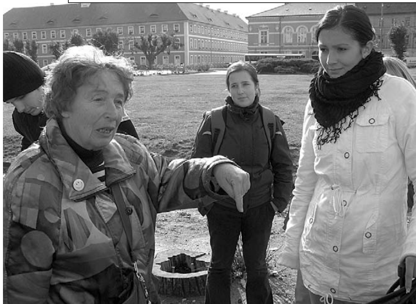
Autentický výklad o těžkém životě mezi zdi terezínských lágrů z úst ženy, která prožila válku v ghettu...