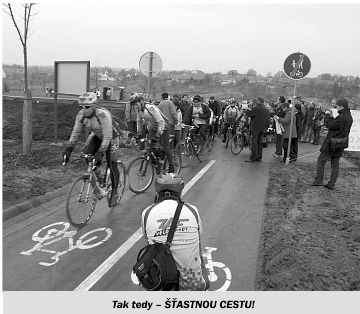
Tak tedy – ŠTASTNOU CESTU!

byla zde jedna z nejvýznamnějších a pro mnohé také jedna z nejdelších, zastávek. S jistotou můžeme tvrdit, že těch pár kroků či šlápnutí do pedálů navíc stálo opravdu za to. Pod rozhlednou byla pro návštěvníky připravena pravá moravská zabijačka, kde nechyběly žádné tradiční lahůdky,