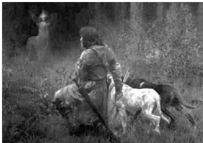
Svatý Hubert – patron myslivců

Podle staré pověsti byl syn augustiánského Bertranda Hugibert vášnivým lovcem. Lovil však bez mysliveckých zásad a zvěř krutě zabíjel. Při jednom lovu na jelena se uštvané zvíře zastavilo, mezi parohy se mu objevil zářící kříž a tajemný hlas vyzýval Huberta k pokání. Ten se po smrti