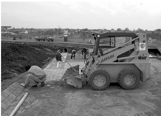
Nový odvodňovací kanál zabráni nežádoucímu zaplavení polí a kolejí při prudkých deštích.

a vinic z trati Nadzahrady do říčky Trkmanky. Starý příkop nevyhovoval. Při bouřkách byly často zaplaveny koleje tak, že musela být provedena výluka dopravy. Za pouhé tři pracovní dny byla vybudována podstatná část díla, které dotváří pěkné prostředí v okolí nového parku.