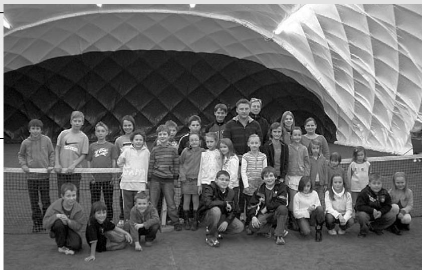
Všechny tyto děti propadly kouzlu tenisové rakety a antukového kurtu, halu proto přivítaly s neskrývaným nadšením.