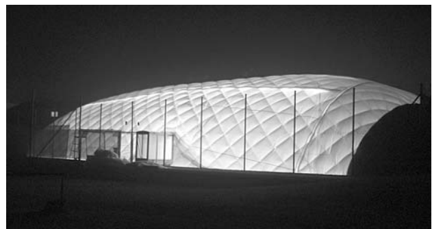
Nová hala umožní tenistům trénovat i za nepříznivého a studeného počasí.

Cena za pronájem haly se pohybuje od 300,- do 400,- Kč/hod., rezervovat hodiny si můžete na telefonním čísle 775 556 669. Na Vaše spokojené návštěvy se těší Dalibor Šefránek - provozovatel tenisové haly.