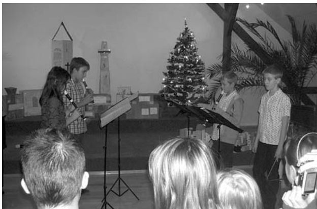
O kulturní program vernisáže se postaral flétnový soubor při ZUŠ Velké Pavlovice Pišťalky.

V pátek 4. prosince 2009 byla ve výstavním sále velkopavlovické radnice slavnostně zahájena výstava s názvem Děti z Modrých Hor aneb Velké Pavlovice očima dětí , kde autory vystavovaných děl jsou žáci 1. a 2. stupně ZŠ.