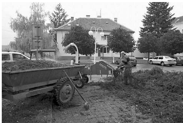
Nový drtič dřevní hmoty v akci.

Služby města vyzkoušely koncem října 2009 poprvé nový drtič dřevní hmoty, který je schopen zpracovat větve do tloušťky 11 cm. Drtič významně pomůže zracionalizovat práci při údržbě stromů a keřů ve městě. Naštěpkovaná hmota se dá použít jako nastýlka proti růstu plevelů a vodní erozi.