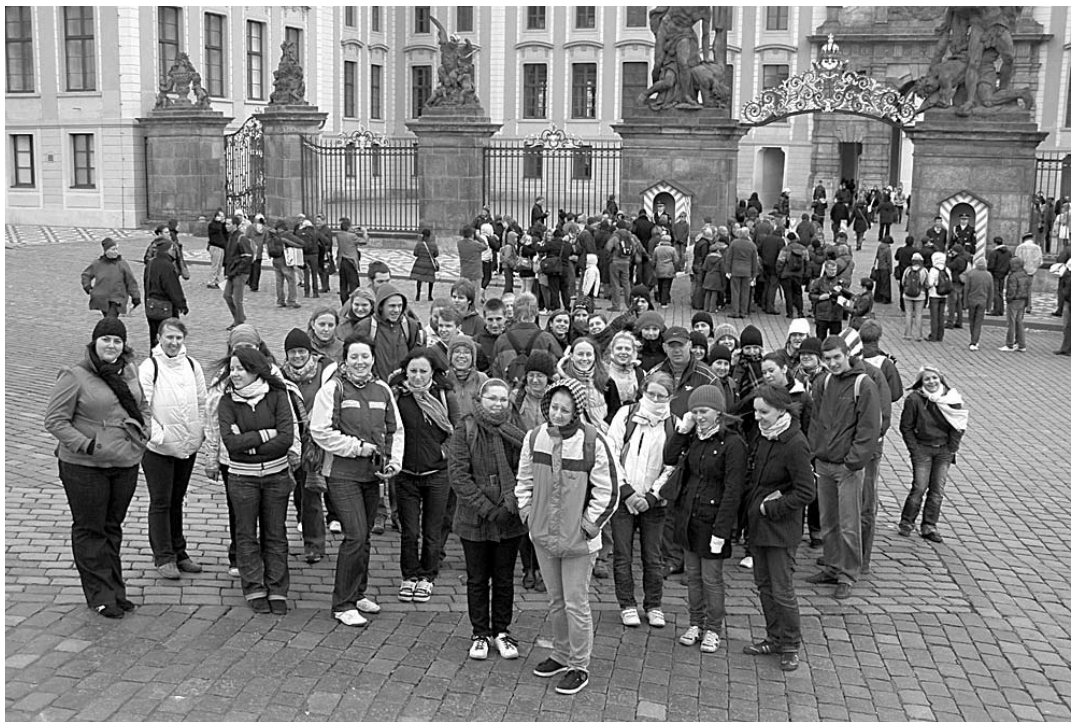
Místo jako stvořené pro společné foto – brána Pražského hradu.

kyně. Ty nás dokázaly i v mrazivém počasí, kdy bychom nejraději seděli v teple u nějakého horkého nápoje, povzbudit milým a zajímavým výkladem.